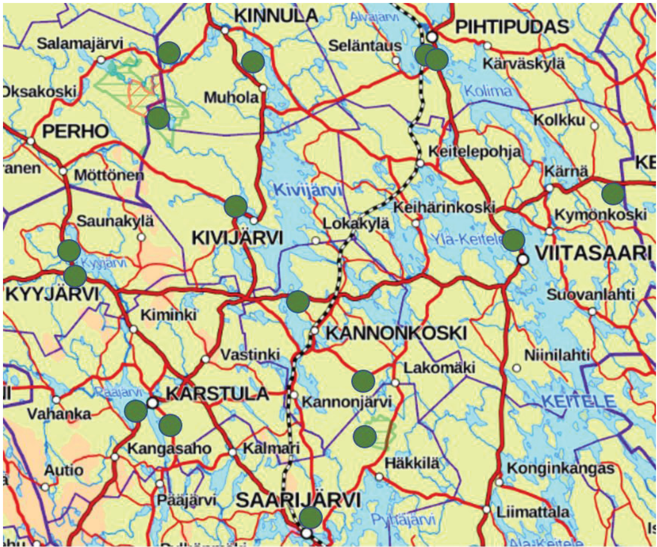
Kuva 1. Osana hankkeen nykytilatarkastelua maastossa arvioitujen reittien sijainti kartalla. ©Metsähallitus (www.retkikartta.fi). Pohjakartta: Maastokartta ©Maanmittauslaitos 1/2014 (9/2020)