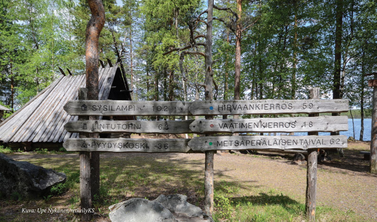
Kuva: Upe Nykänen/reitkeilyKS